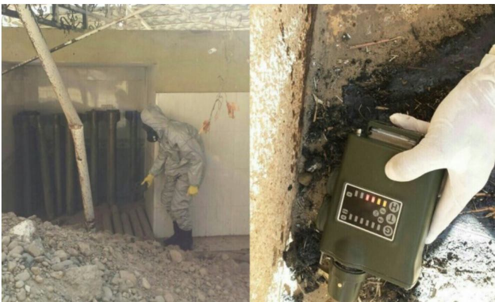
Soldados iraquíes capturaron un alijo de armas químicas del ISIS en Qayarah, Irak , los cohetes dieron positivo en mostaza de azufre, en octubre de 2016.

El último uso de la mostaza sulfurosa en la batalla se confirmó en Siria en 2016. Según la BBC , los yihadistas del Estado Islámico (ISIS) usaron gas mostaza contra las fuerzas gubernamentales en Deir- ez-Zor. Se confirmó que el mismo gas químico fue utilizado por ISIS contra los kurdos en el norte de Iraq. Según The Independent , la Organización para la Prohibición de las Armas Químicas (OPCW) confirmó que las pruebas de laboratorio habían resultado positivas para la mostaza azufrada, después de que alrededor de 35 tropas kurdas cayeron enfermas en el campo de batalla en agosto de 2015.