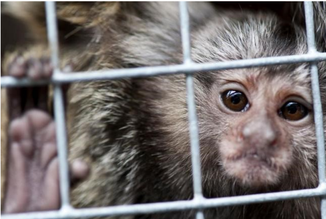
Los monos Marmoset son infectados experimentalmente en Porton Down con Ebola, Anthrax, Virus de Marburgo y otros patógenos mortales. Los científicos miden el tiempo hasta la muerte y la dosis letal de exposición al agente biológico.

Los animales utilizados incluyen ratones, cobayos, ratas, cerdos, hurones, ovejas y primates no humanos. Algunos de los experimentos mortales han sido patrocinados por el Pentágono bajo contratos entre DSTL y DTRA. Los científicos de Porton Down han infectado o envenenado animales para medir el tiempo hasta la muerte y la dosis letal de exposición. En la práctica, el posible uso del virus / gas químico investigado como arma.