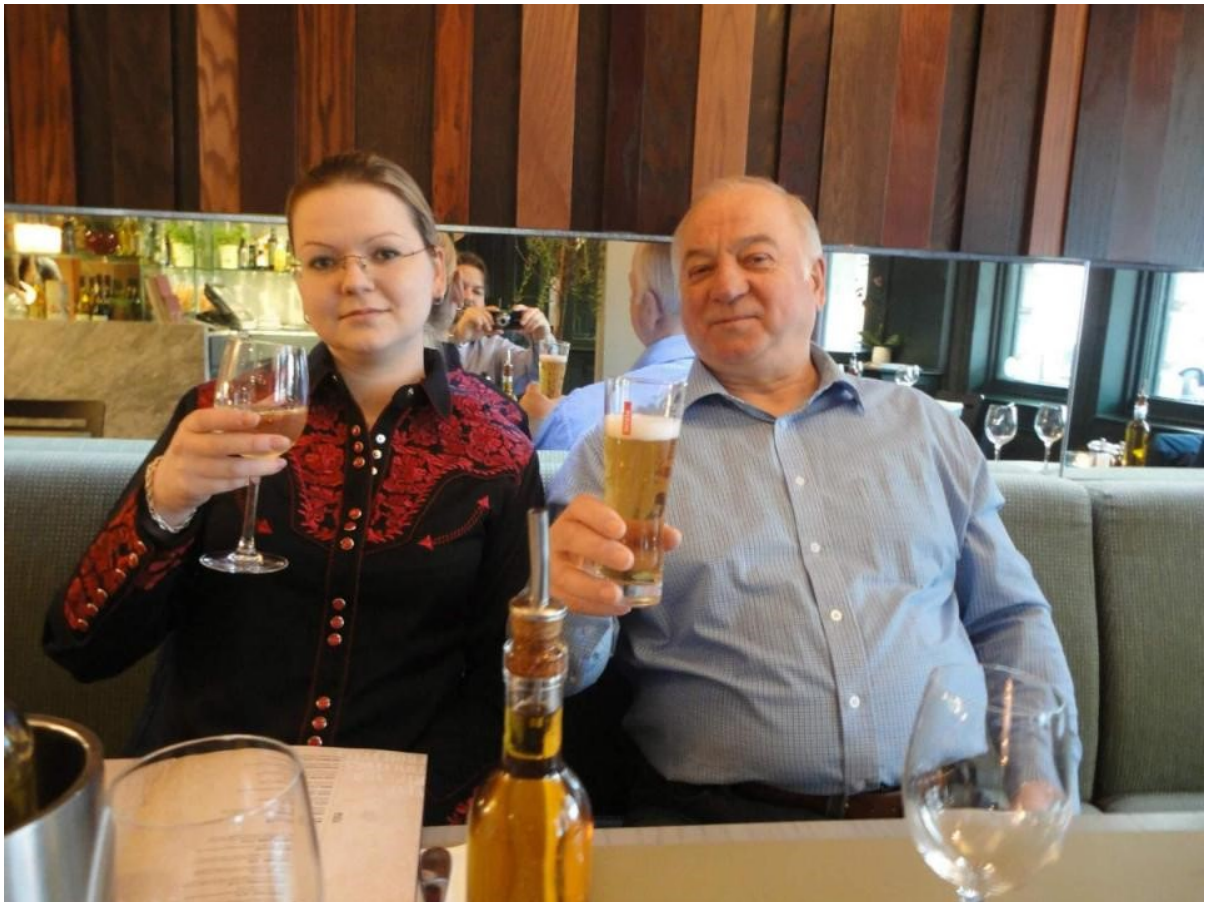
Sergei Skripal y su hija Yulia

Las pruebas con agentes nerviosos VX y VM en conejillos de indias se llevaron a cabo en Poton Down en 2015. El proyecto fue financiado por el Ministerio de Defensa del Reino Unido. Curiosamente, también se encontraron cerdos de Guinea en la casa de Sergei Skripal en Salisbury, a pocos kilómetros del laboratorio militar y biológico secreto. Una foto de las mascotas de los Skripals, un gato y conejillos de Indias, fue publicada por su hija Yulia en Facebook.