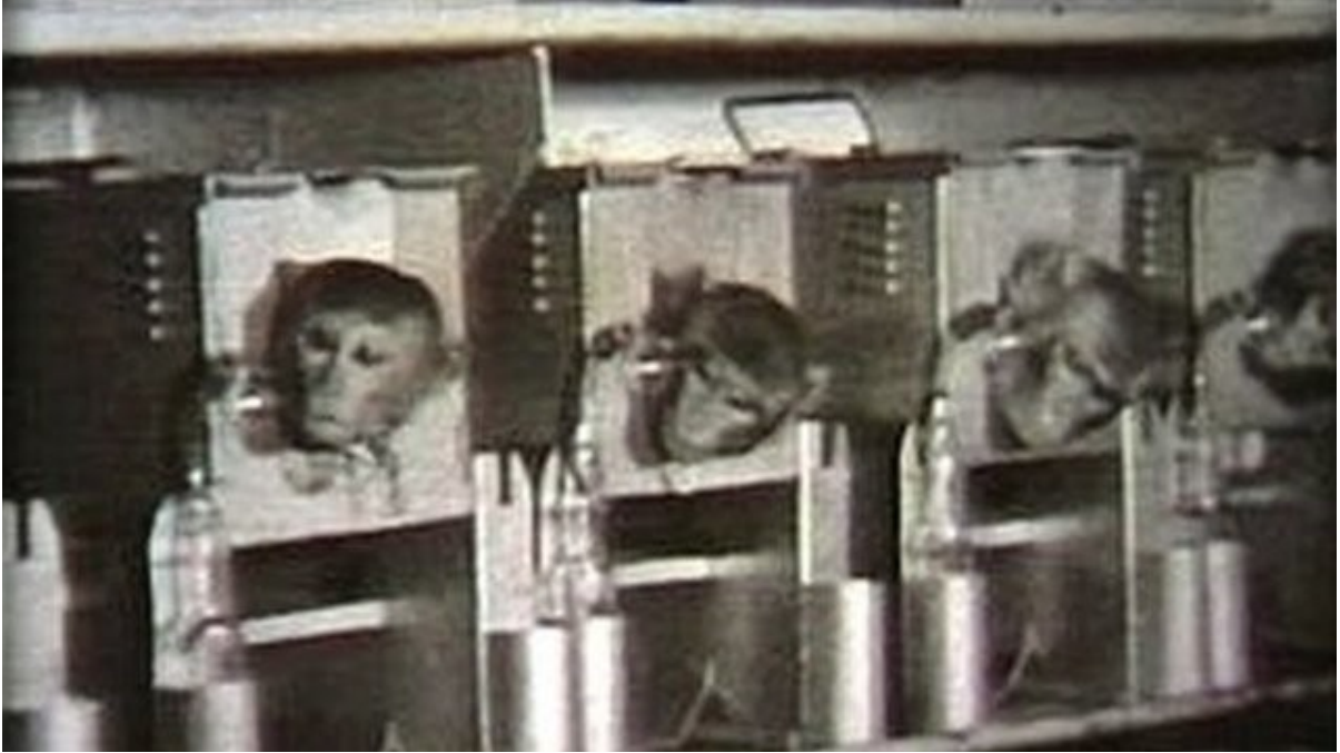
Monos utilizados en pruebas de agentes de guerra en Porton Down en el pasado

Los animales utilizados incluyen ratones, cobayos, ratas, cerdos, hurones, ovejas y primates no humanos. Algunos de los experimentos mortales han sido patrocinados por el Pentágono bajo contratos entre DSTL y DTRA. Los científicos de Porton Down han infectado o envenenado animales para medir el tiempo hasta la muerte y la dosis letal de exposición. En la práctica, el posible uso del virus / gas químico investigado como arma.